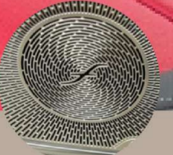
Burmester® עם 15 מקולים (725 וואט) ליצירת צליל היקפי אמיתי