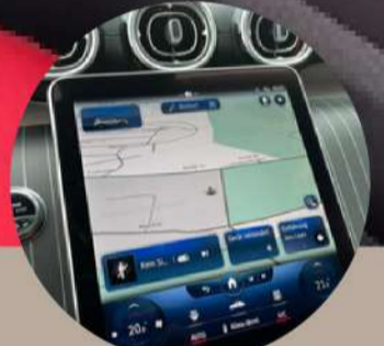
צג-מגע מרכזי בגודל 11.9" עם MBUX