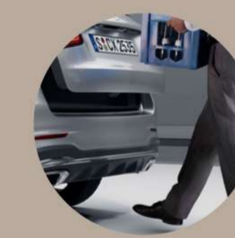
תא-מטען עם פתיחה חשמלית תיחת הרכב ונעילה ללא שימוש במפתח Keyless Go