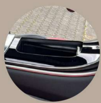
גימור עץ פנימי שחור עם קווי אלומיניום