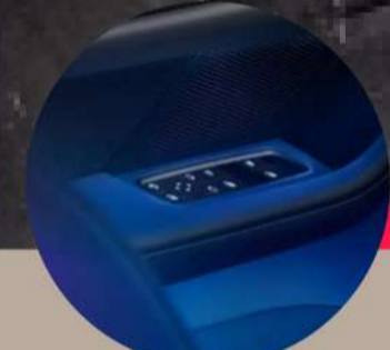
תאורת אווירה פנימית מורחבת בעלת 64 גוונים