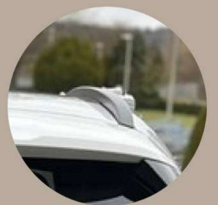
חבילת Night Package חיצונית: קשתות גג מושחרות