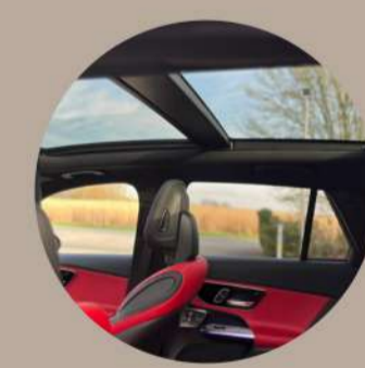
גג זכוכית פנורמי עם פתיחה חשמלית