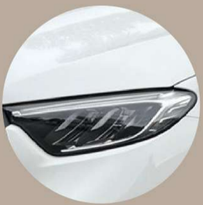
High Performance LED אור-גבוה