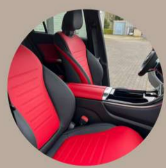
מושבי נוחות בריפוד עור נאפה דו-גווני בצבע אדום ושחור