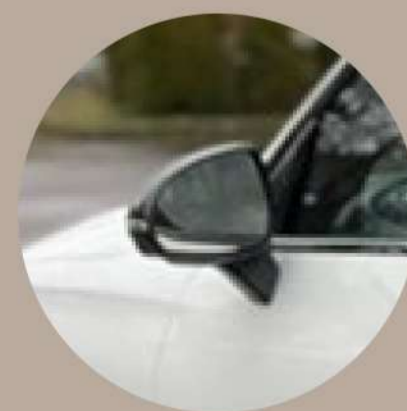
חבילת Night Package חיצונית: מראות מושחרות