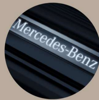
דלתות קדמיות בכיתוב Mercedes – "Benz"