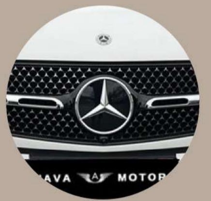
סבכת מנוע בעלת מדף אחד וסמל הכוכב