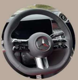
גה ספורט קטום בעיצוב AMG Line ומנופי העברת הילוכים מההגה