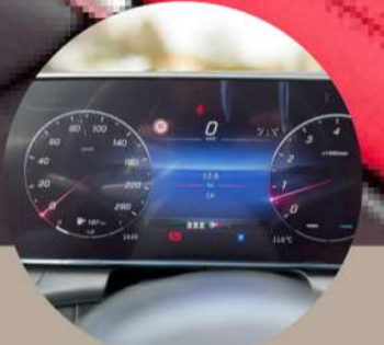
לוח שעונים דיגיטלי בגודל 12.3"