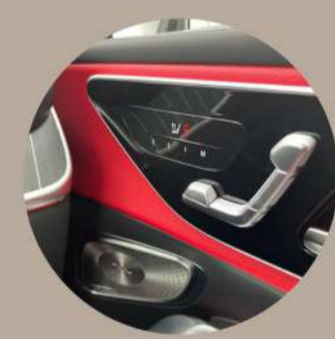
כיוון חשמלי למושב הנהג והנוסע ו-3 זכרונות עבור כל מושב