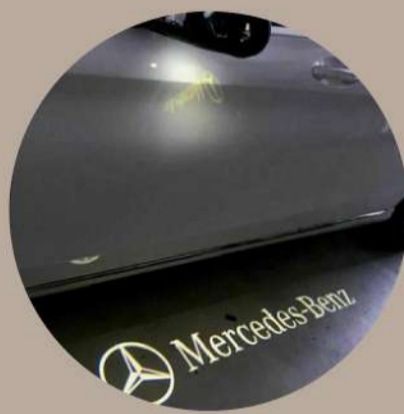
הקרנת סמל מרצדס ממראות הרכב