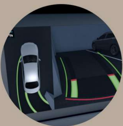
מצלמות היקפיות 360° עם פסי הכוונה דינמיים