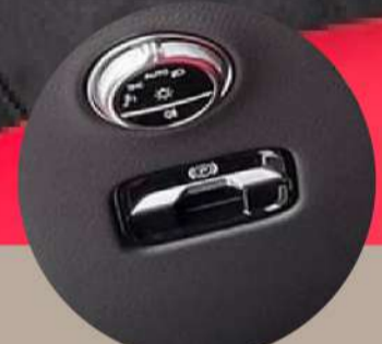
בלם יד אלקטרוני עם מתלי נוחות