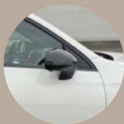
חבילת מראות הכוללת קיפול מראות-צד חשמל