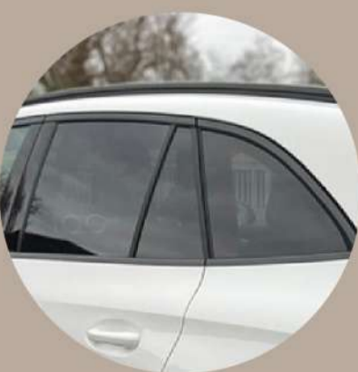
חלונות אחוריים כהים