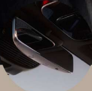
מראה מרכזית עם עמעום אוטומטי למניעת סינוור