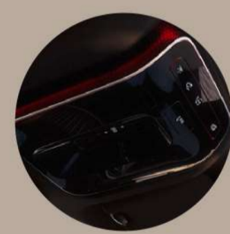
Sight&Light תאורת היצף תאורת קריאה תאורה בידיות תאורה לרגליים