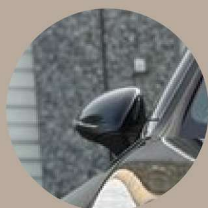
חבילת מראות הכוללת קיפול מראות-צד חשמל