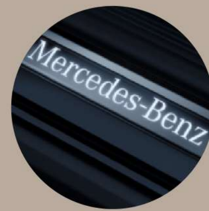
דלתות קדמיות בכיתוב Mercedes – "Benz