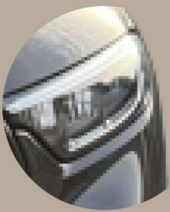
High Performance LED אור-גבוה