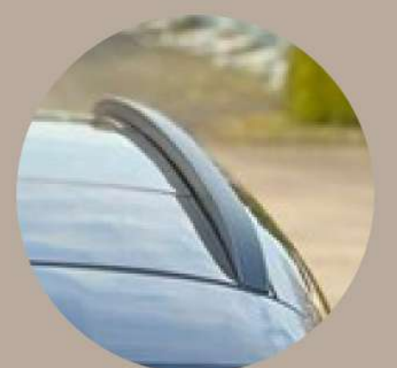
חבילת Night Package חיצונית: קשתות גג מושחרות