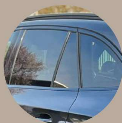
חלונות אחוריים כהים