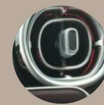
בקרת אקלים אוטומטית, מפוצלת ל-2 אזורים עם יציאות לשורה השנייה