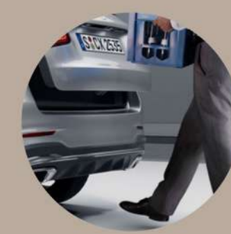
תא-מטען עם פתיחה חשמלית תיחת הרכב ונעילה ללא שימוש במפתח Keyless Go