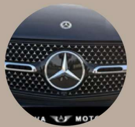
סבכת מנוע בעלת מדף אחד וסמל הכוכב