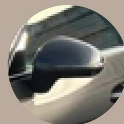
חבילת Night Package חיצונית: מראות מושחרות