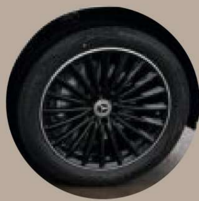
חישוקי סגסוגת מרובי צלעות בגודל "20 מושחרים