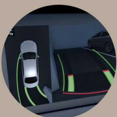
מצלמות היקפיות 360° עם פסי הכוונה דינמיים