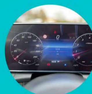
לוח שעונים דיגיטלי בגודל "12.3 עם מצבי תצוגה משתנים מערכת MBUX עם צג-מגע מרכזי בגודל "11.9"