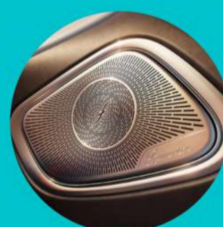
מערכת שמע של Burmester בעלת 15 רמקולים ואפקט D3