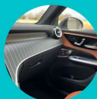
חבילת כרום פנימית