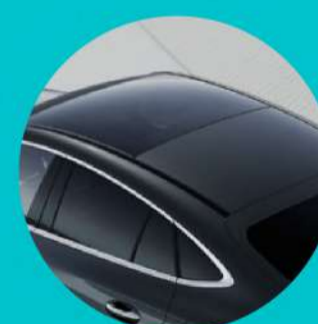
גג זכוכית פנורמי עם פתיחה חשמלית