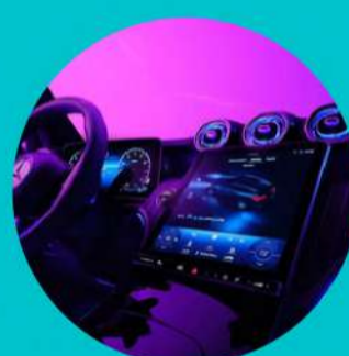
תאורת אווירה פנימית מורחבת בעלת 64 גוונים