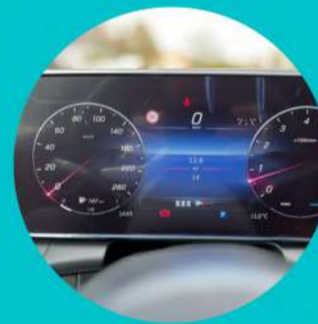
לוח שעונים דיגיטלי בגודל "12.3 עם מצבי תצוגה משתנים מערכת MBUX עם צג-מגע מרכזי בגודל "11.9