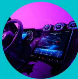
תאורת אווירה פנימית מורחבת בעלת 64 גוונים