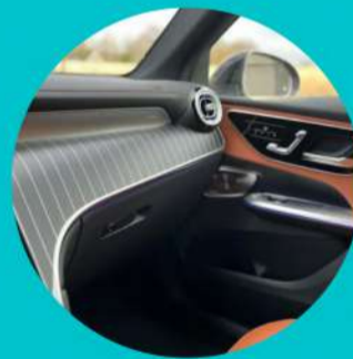
חבילת כרום פנימית