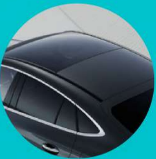
גג זכוכית פנורמי עם פתיחה חשמלית