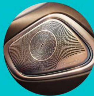
מערכת שמע של Burmester בעלת 15 רמקולים ואפקט D3