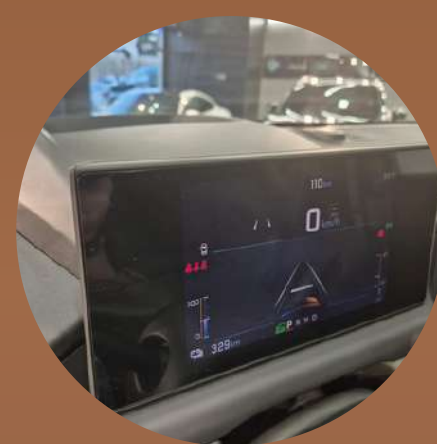
לוח שעונים דיגיטלי