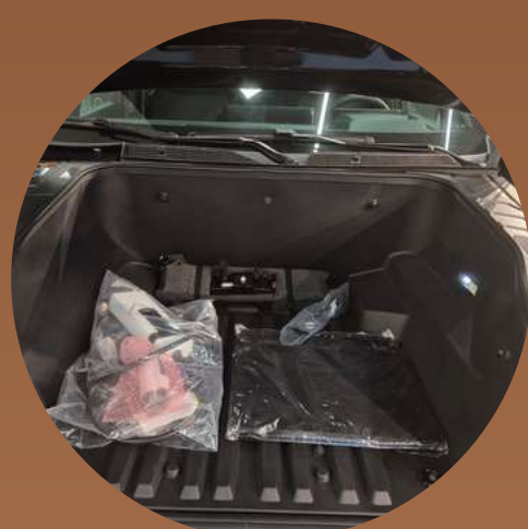
תא מטען קידמי