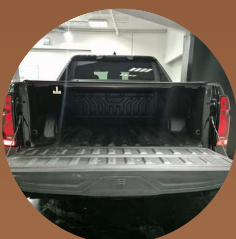
אמבטיה עם כיסוי כושר העמסה 7650 ק"ג