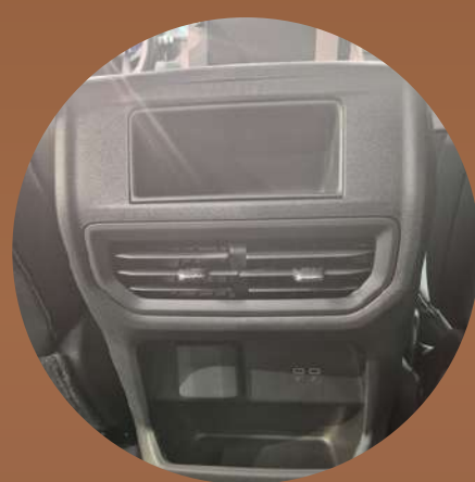
בקרת אקלים + פתחי איורור מאחור