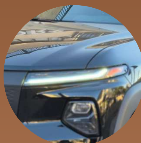
פנסי חזית ופנסים אחוריים LED