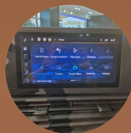
מערכת מולטימדיה 11" עם חיבור לאיפון ואנדרואיד