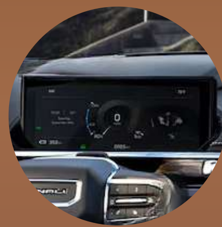
לוח שעונים דיגיטלי 11"