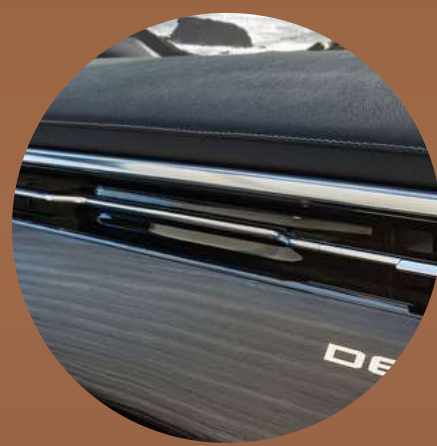
פנימי משולב עץ יוקרתי