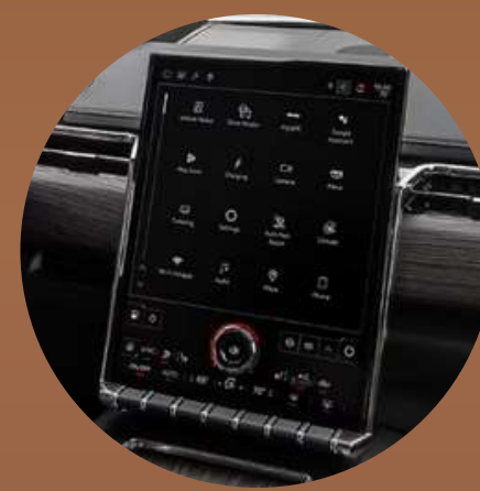
מערכת מולטימדיה 16.8" עם חיבור לאיפון ואנדרואיד