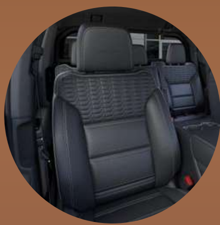
מושב עור חשמליים עם זיכרונות עם חימום וקירור