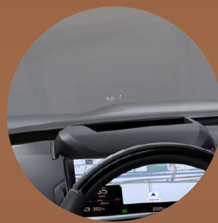
תצוגת עילית 14"